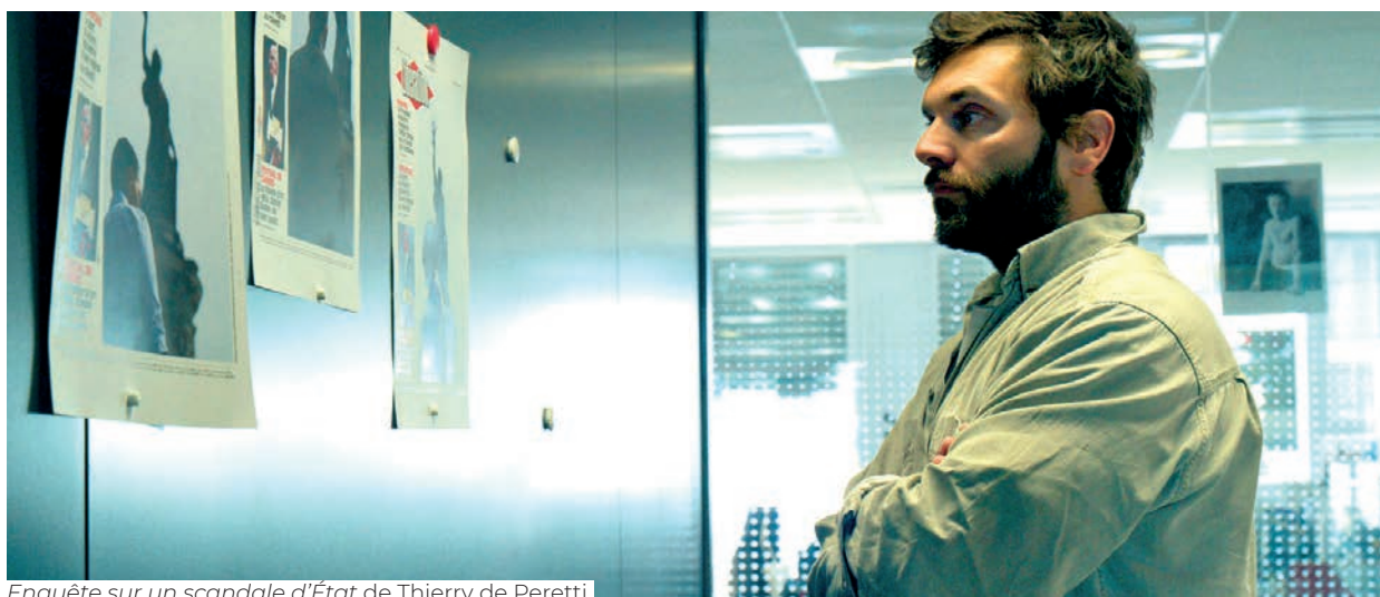
Enquête sur un scandale d'État de Thierry de Peretti