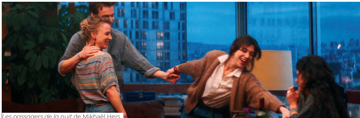
Les passagers de la nuit de Mikhaël Hers