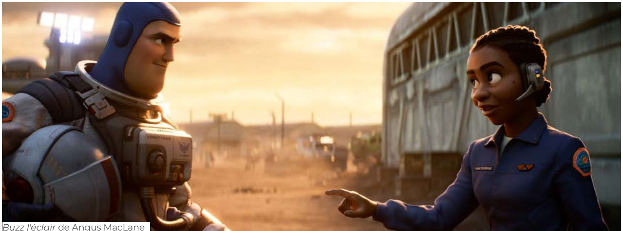
Buzz l'éclair de Angus MacLane