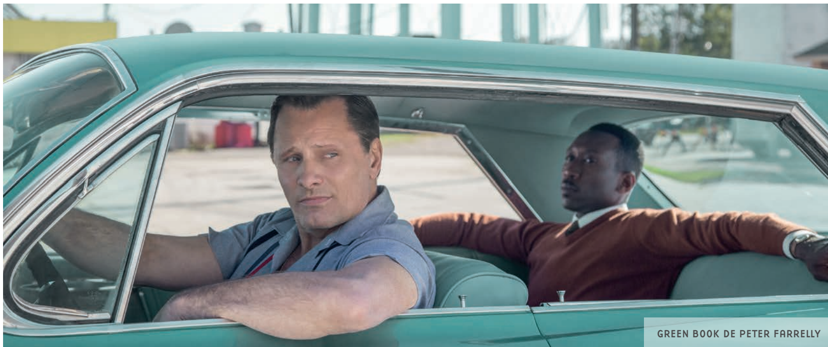
GREEN BOOK DE PETER FARRELLY