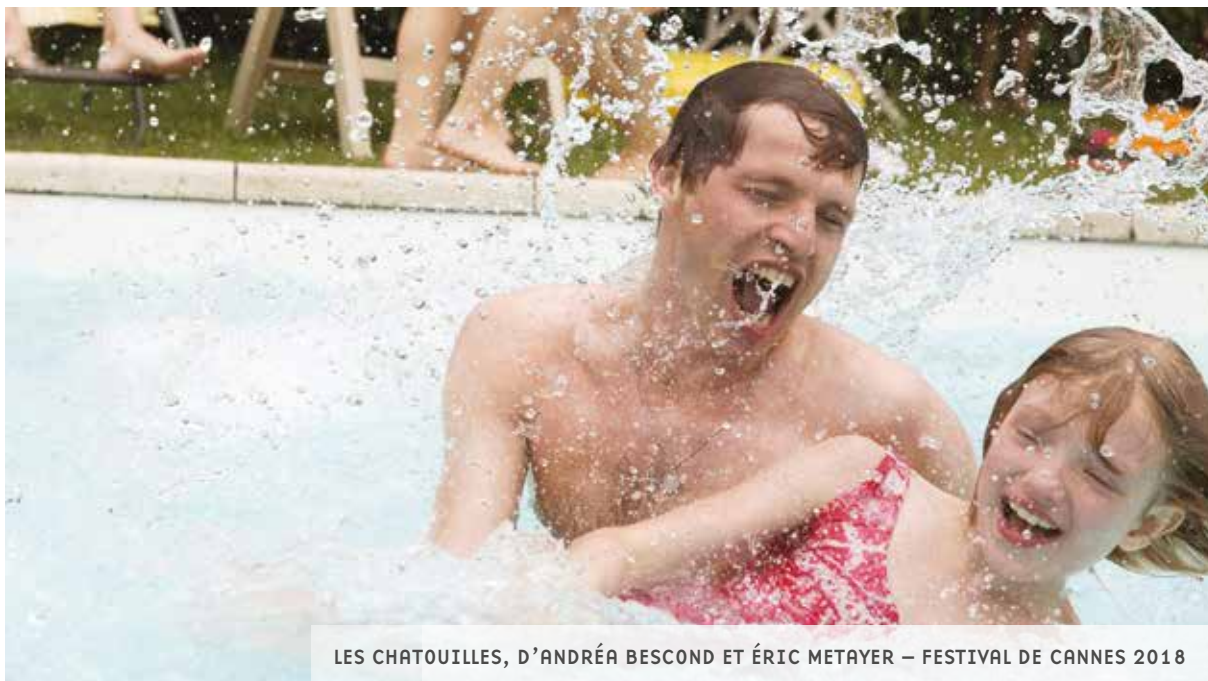
LES CHATOUILLES, D'ANDRÉA BESCOND ET ÉRIC METAYER – FESTIVAL DE CANNES 2018