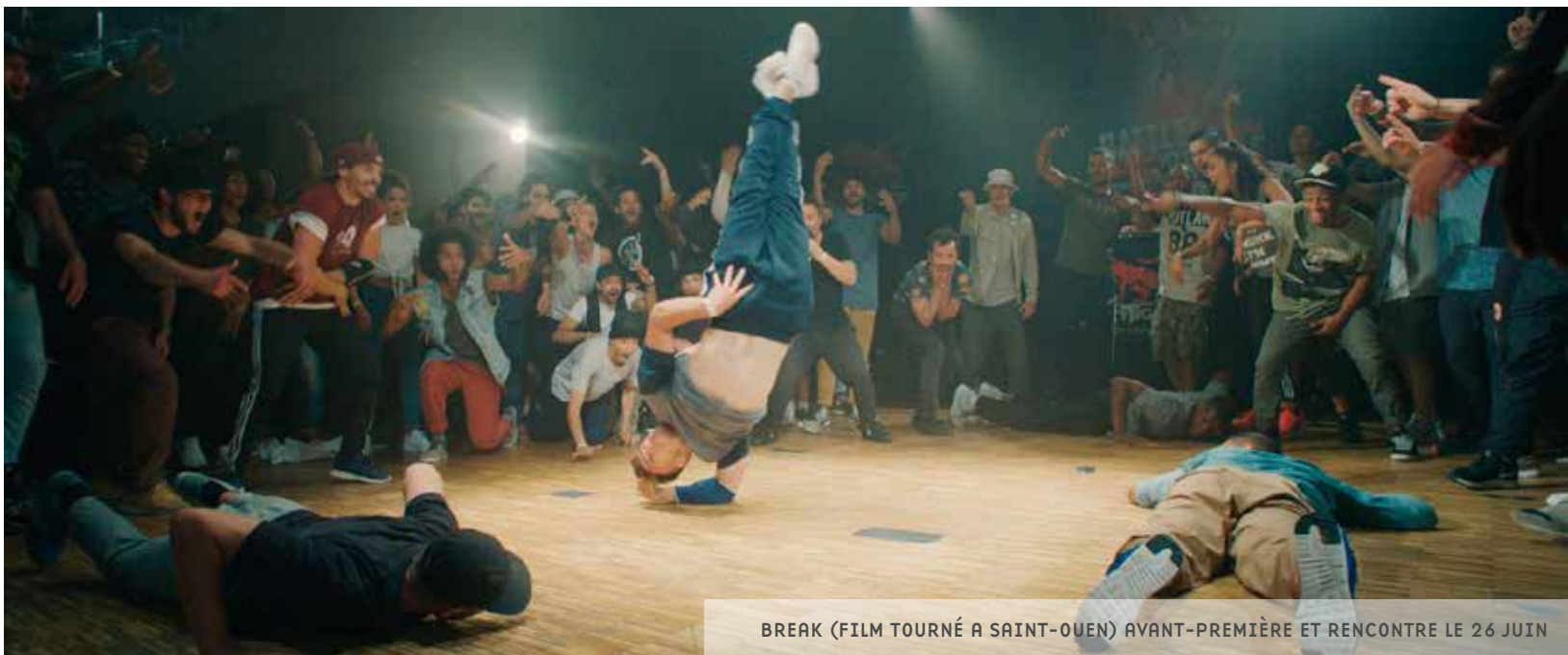
BREAK (FILM TOURNÉ A SAINT-OUEN) AVANT-PREMIÈRE ET RENCONTRE LE 26 JUIN