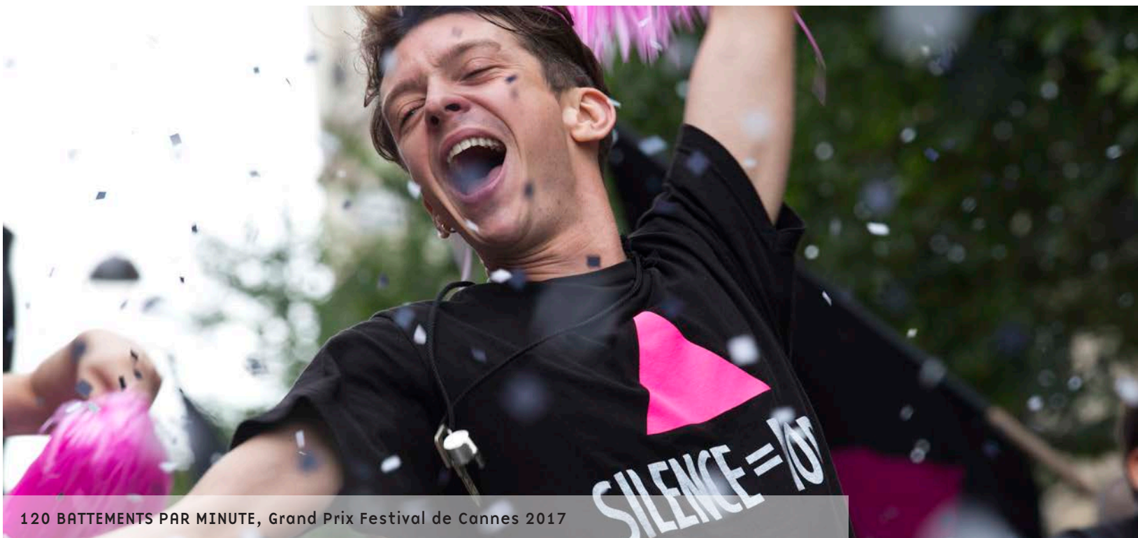
120 BATTEMENTS PAR MINUTE, Grand Prix Festival de Cannes 2017